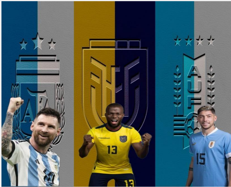
Ilustración original donde aparecen Lionel Messi, Enner Valencia y Federico Valverde

El pasado 2 de septiembre del presente año, el conjunto ecuatoriano realizó su primer entrenamiento en Buenos Aires (Argentina), contando con algunos jugadores de la lista de convocados para la primera y segunda fecha de eliminatorias para el mundial 2026, entre ellos la joven promesa del fútbol ecuatoriano o "La joya ecuatoriana" como es reconocido por los hinchas de la tricolor, su nombre es Kendry Paéz (IDV) que con tan solo 16 años ya promete ser el futuro del fútbol ecuatoriano.