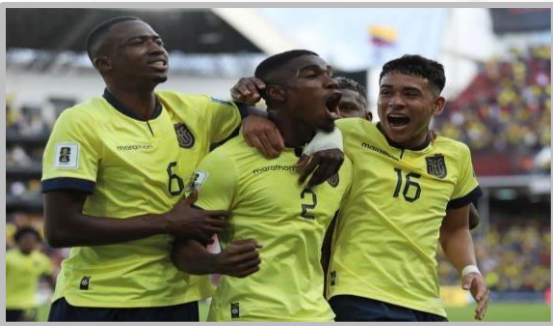
Fotografía tomada del partido de Ecuador vs Uruguay

ecuatoriana "Tiene un futuro increíble. A Kendry no le pesó la camiseta, se la puso con personalidad, cuando el partido estaba apretado, él pedía la pelota" dijo el ex seleccionado del Ecuador. Los ecuatorianos Moisés Caicedo (Chelsea) y Kendry Paéz (IDV), fueron elogiados como la mejor dupla del Ecuador, los hinchas de la tricolor, esperan la llegada del joven Paéz al equipo Inglés, equipo en el que juega Moisés Caicedo, el cual no dudan el que el jugador de Independiente hará lo que sabe hacer.