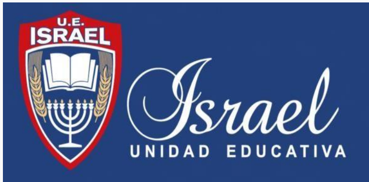
Logo oficial de la U.E. "Israel"

Los docentes, estudiantes y directivos de cada Unidad Educativa, incluyendo la Unidad Particular "Olga Meza Santana" entablaron respuestas ante casos de mejoras y desmejoras ante la modalidad virtual.